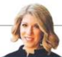
Η ΛΑΜΠΡΙΝΗ ΡΟΠΗ